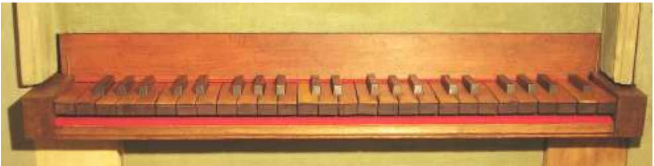
Sopra: tastiera originale. Sotto: pedaliera originale e comandi di registrazione prima del restauro.

Manticeria: costituita da 2 mantici a cuneo originali e da un mantice a vasca collocato in occasione del recente restauro sotto la pedana su cui poggia lo strumento; azionamento manuale a funi con pulegge oppure con elettroventilazione.